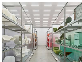
07 Installationsansicht »Colour Rush! Eine Installation von Sabine Marcelis, Vitra Schaudepot © Vitra Design Museum, Foto: Mark Niedermann © VG Bild-Kunst, Bonn 2023