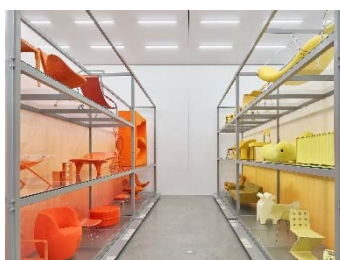
05 Installationsansicht »Colour Rush! Eine Installation von Sabine Marcelis, Vitra Schaudepot © Vitra Design Museum, Foto: Mark Niedermann © VG Bild-Kunst, Bonn 2023