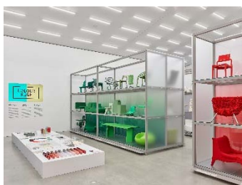
02 Installationsansicht »Colour Rush! Eine Installation von Sabine Marcelis, Vitra Schaudepot © Vitra Design Museum, Foto: Mark Niedermann © VG Bild-Kunst, Bonn 2023