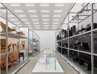
08 Installationsansicht »Colour Rush! Eine Installation von Sabine Marcelis, Vitra Schaudepot