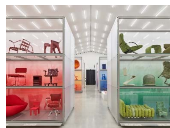
06 Installationsansicht »Colour Rush! Eine Installation von Sabine Marcelis, Vitra Schaudepot © Vitra Design Museum, Foto: Mark Niedermann © VG Bild-Kunst, Bonn 2023